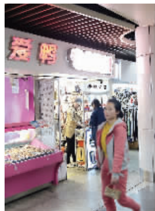
卖鸭脖子的也不少

昨天,南京地铁部门发布了3号线南京站28个商铺的招租公告。和新开通的3号线正在为商铺“找主人”不同,1号线、2号线等线路的地铁商铺都已有了很旺的人气。昨天下午,现代快报记者探访了新街口站、鼓楼站、南大仙林站等5个站点。最多的商铺、最火的商铺……我们为你盘点一二。实习生 匡郁华 潘冰妍 现代快报记者 张瑜 欧阳丽蓉/文