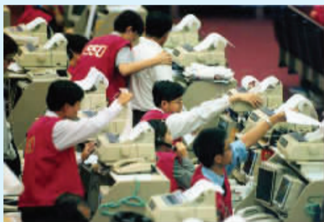
繁忙的港股交易员