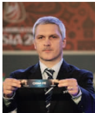
国足抽中上上签，主帅佩兰都乐了

昨天，国足前主帅朱广沪在接受现代快报记者电话采访时说：“首先恭喜佩兰的国家队，这个签还是不错的。不过，同组的马尔代夫、中国香港队，我们不能忽视，以前国足在世预赛中也碰到过这两个球队，1985年我们还输给过中国香港队，就是轻敌惹的祸。2001年也碰到过马尔代夫，很多人在赛前都觉得我们去客场将轻松获胜，但最后球队也仅仅赢了一个球。所以，国足这一次不能在这些弱队中犯任何错误，毕竟万一与卡塔尔两战打不好，而在这些弱队身上捞足了净胜球，还可以以小组第二成绩出线。”