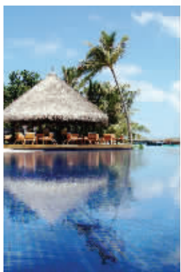
马尔代夫是旅游胜地

客场对阵马尔代夫，国足赢球也没问题，旅游自然也应该摆上台面。马尔代夫由1200多个小珊瑚岛组成，是亚洲最小的国家，在首都马累，当地有全世界最好的潜水教练，赢球之后的国足将士们完全可以去体验一下身在海洋里的感觉，甚至他们还可以去苏妮瓦芙美士海滩踢一场沙滩足球。