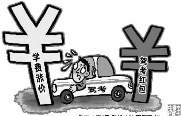
漫画:“夹”考 商海春作

截至2014年末,我国机动车驾驶人已突破3亿人。按照交通法规要求,驾驶机动车应当依法取得机动车驾驶证,而大大小小的驾校是居民通过驾考取得驾照的主要渠道。