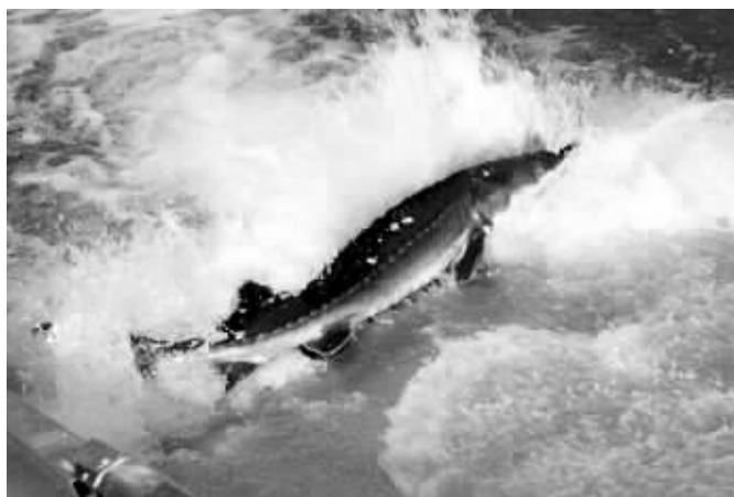
中华鲟“特种部队”出征长江

2014年,中华鲟研究所首次对中华鲟进行了声呐追踪,在18尾中华鲟体内植入了声呐标记,