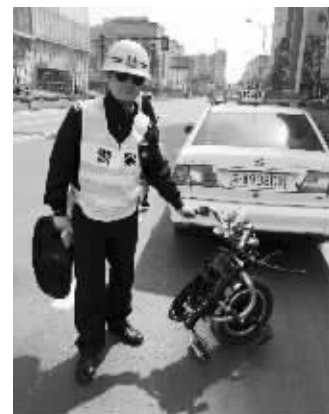
交警查获的独轮电动车

怕堵车,就将独轮车骑上路了。民警表示,这种独轮车不符合国标规定的非机动车运行安全技术条件,不能上牌,不能上路行驶。民警根据相关规定进行暂扣车辆的处罚。