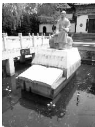
离曹雪芹像不远处的一块水面

公园办公室相关负责人表示,公园里的湖水这两天都处于正常状态。“风大,树叶等物刮下来我们也挡不住,已经安排人定时打捞。”他表示,这两天风大,湖边树叶、花瓣等被吹到水里,还有不少杂物。“湖里一定要长水草,否则水质会腐化。”该负责人表示,水草