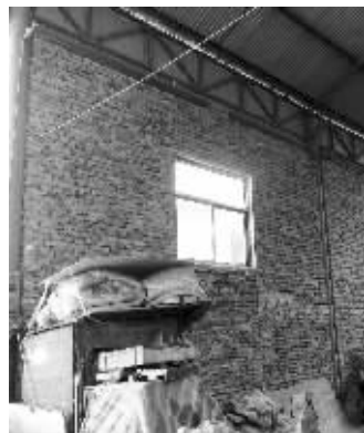
红砖砌成的墙将菜场与外面的小区分隔开

菜场管理方泰亿投资管理公司一名负责人告诉记者,之所以砌围墙,主要是因为附近居民反映菜场太吵,砌墙后,菜场对于道路、对面小区的影响小多了,围墙并没有超过菜场的范围。菜场要盖违建牟利