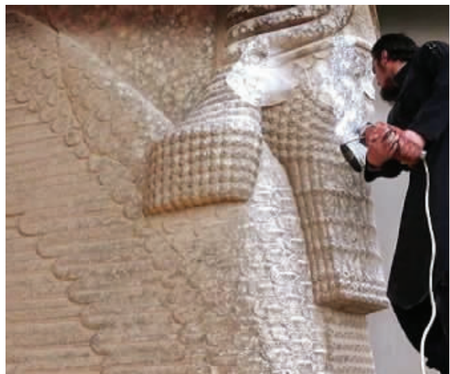
一名武装人员用电钻破坏雕像

极端组织“伊斯兰国”11日在网络上发布视频显示，这一组织武装人员在伊拉克北部的亚述古城遗址尼姆鲁德肆意破坏文物、发动大规模爆炸，几乎把这处遗址夷为平地。英国广播公司说，这段视频似乎证实了媒体今年3月对“伊斯兰国”破坏尼姆鲁德古城遗址的报道。