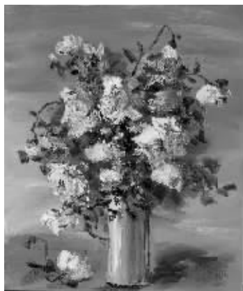
盛梅冰《紫色调花卉》