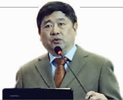
单霁翔在论坛上演讲