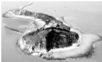
秦山岛全貌

江苏海洋渔业局海域和海岛管理处工作人员介绍，从远处看，秦山岛的总体面貌像个蝌蚪，尾巴部分就是神路，退潮时“神路”就会显现出来。这条路其实是沙子在海里堆积成的一个狭长弯曲的沙脊，经过千万年的海水冲刷，七彩缤纷的秦山砾石堆积成一条蜿蜒绵长的小径，洁白的莹石、染红的鸡血石、青艳的石英绿，还有橙黄、黑灰、紫蓝等等，组成了一条彩色神路。