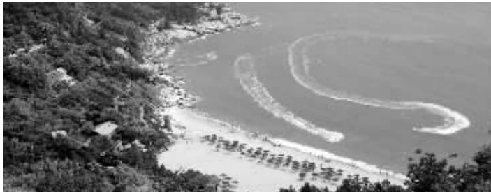
连岛苏马湾生态园

连岛是江苏第一大岛，面积7.57平方公里，沿岛海岸线17.66公里，与连云港东部城区相连。这个岛的森林覆盖面积达80%，自然风光秀丽迷人，是国家4A级景区、国家级海洋特别保护区。