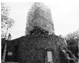
玄奘塔已被围挡起来

那么,会怎么修呢?“对破损严重的地方进行替换。”传真说,修缮主要针对破坏比较严重的塔顶和三、四、五层,施工过程中将对每一块砖块进行编号,保证它们修缮后能顺利回到原位。而且,寺庙还会特意从苏州订购砖块,“和原来的砖块更相似,尽量保证修旧如旧”。