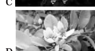
A B C D

7.南京农业大学的两个“90”后研究生,最近在联合国当实习生,他们所在的机构是UNDP,你知道中文翻译是什么吗?( )