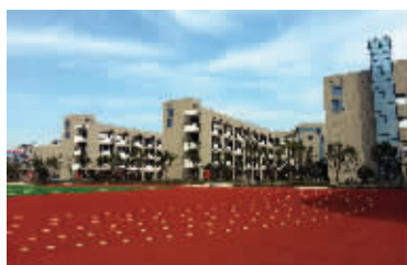
雨花台实小善水湾分校实景图

近日教育部对2015年中小学招生工作作出明确要求，要求重点城市所有县市区100%的公办小学、90%的公办初中要实现划片入学。虽然南京的细则尚未出台，但教育部的规定也已宣告在南京上小学想跨区择校更加不可能了，学区房是进入理想小学的唯一途径。