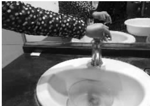
楼层高的盐城市民家中断水