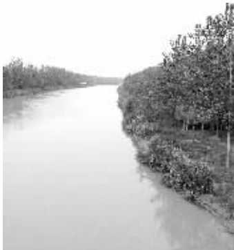
盐城通榆河取水口有异味 网络图片