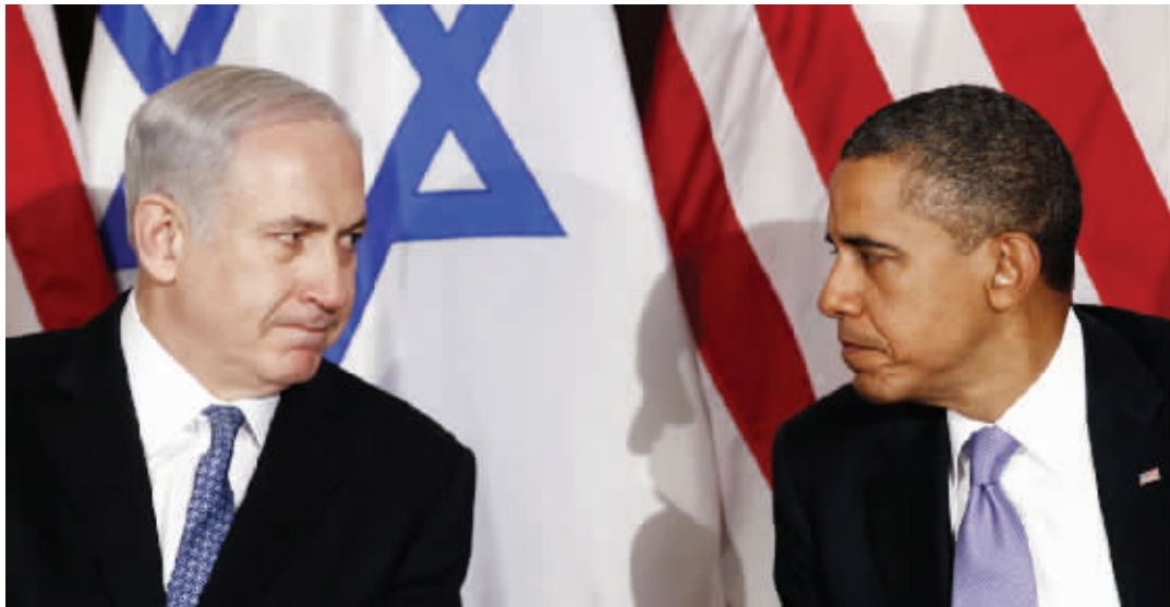
美国总统奥巴马与以色列总理内塔尼亚胡

美国总统奥巴马6日拒绝以色列先前有关伊朗核问题协议须包括承认以色列地位的要求,说这是“基础性判断错误”。