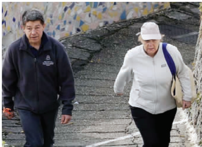
德国总理默克尔和丈夫休闲装扮