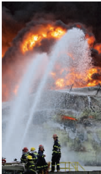
4月7日,福建消防官兵在事故现场扑救

福建漳州市古雷腾龙芳烃有限公司发生爆燃事故后,经当地环保部门检测,未造成环境污染。据事故处置指挥部昨天提供的信息,福建漳州古雷石化大火在被扑灭后,又于19点45分左右复燃。随后,消防官兵紧张地组织灭火。