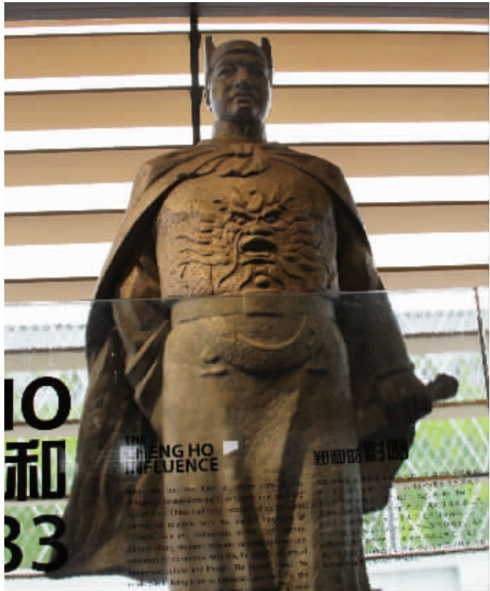
上海世博会期间印尼馆的郑和雕像

“比郑和早620年,已有中国人下西洋,这真的很有可能!”伊拉克大学历史学院考古学家阿德尔·法克,日前在接受新华社驻伊拉克记者采访时这样说。