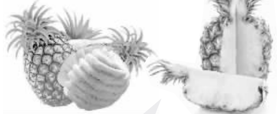
菠萝和凤梨的叶子不同,最重要的是凤梨(右)没有内刺,削皮后直接食用

美食界中有很多对“孪生兄弟”,它们往往因为长得太像而让大家傻傻分不清。这些食物乍看上去确实很像,但是只要留意细节还是很容易分辨的。 宋新晨