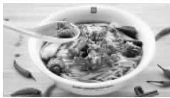
米粉(上)是“柔绵筋道”,米线则是“水灵筋道”,也更细一些