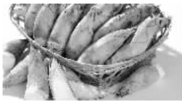
冬笋(上)皮是金黄色的,春笋皮虽发黑,笋尖却是绿色的