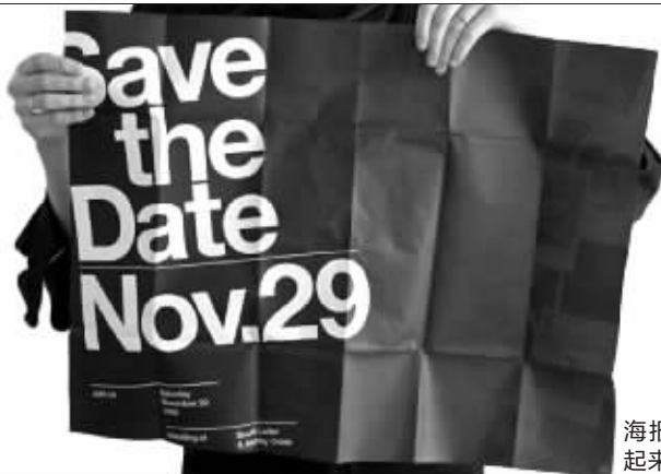
海报款请柬看起来很高大上