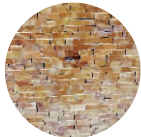
缺失的马赛克