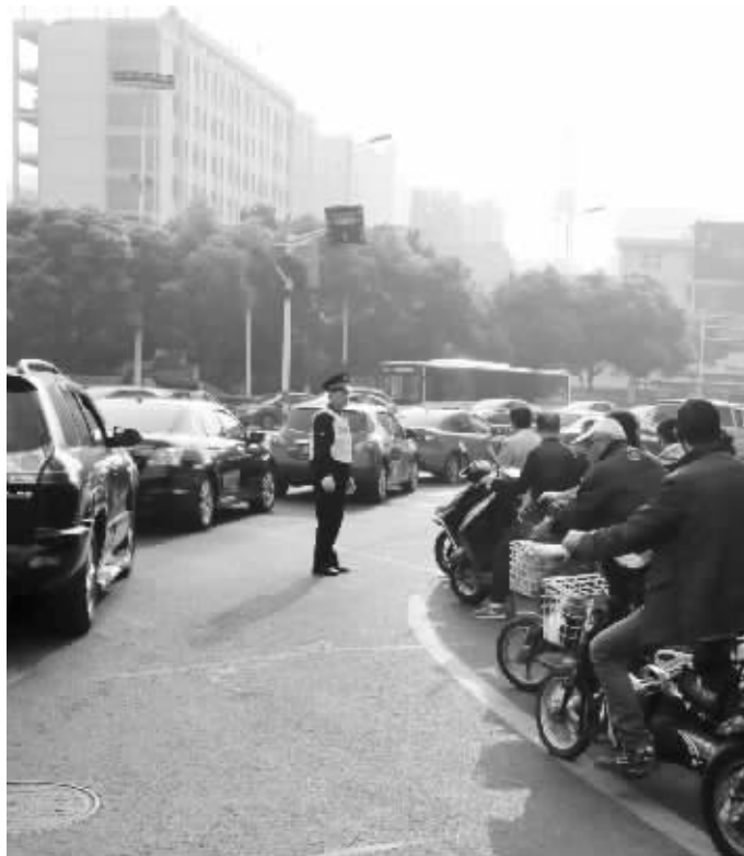
地铁开建第一天,沿线交通没出现大面积拥堵

为配合地铁一号线的建设,昨天零点起,同济桥、新丰桥开始封闭施工改造。由于提前宣传告知,加上交警组织疏导得当,地铁围挡施工段交通平稳有序,没有发生预想中可能出现的拥堵情况。不过,由于众多司机主动避开同济桥和新丰桥,选择绕行,因此,周边德安桥、桃园路、怀德路、延陵路、文化宫等路段车流量有显著增加,一度出现了车多缓行的局面。 焦荆 葛小林