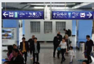
在南京南站,3号线换乘1号线很方便