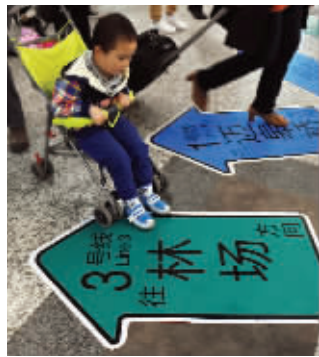
乘客们在南京南站准备换乘