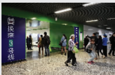
在大行宫站换乘很轻松

走出通道,顺着提示穿过换乘大厅,在地铁3号线入口扶梯处,一名地铁女员工站在高高的凳子上,手里拿着“地铁3号线 林场方向”的指示牌,上面的箭头清晰地指示出方向。顺着电梯向下一层,便找到了3号线。运行首日,部分乘客摸不清方向,前来问路,地铁工作人员都一一进行了解答。看着手机上显示的时间,一趟换乘下来,记者花了6分钟。如果有旅客带有大件行李,电梯上上下下,再加上长长的通道,可能要十来分钟。