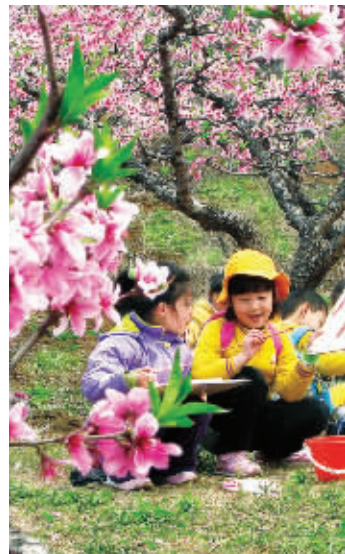
阳山桃花盛开,吸引不少游客赏花踏青

顺丰速运看中这一商机,积极同桃园村进行合作,设立电商村。顺丰速运无锡区相关负责人告诉记者,为满足阳山水蜜桃农户个性化、定制化的需求,他们将提供定制化发件、全程专人跟进等服务,还投入包括优先配载、优先派送、直发操作、特别包装等环节的运作设计。而牵手顺丰速运后,桃园村种植的水蜜桃远销新疆、西藏等全国各地市场将成为新常态,再远的客户在网上订购后,最快24小时内就能品尝到最正宗的阳山水蜜桃。