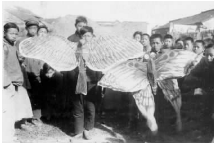
民国风筝比赛旧影 资料图片

1936年清明期间，安德门石子岗举办了一次规模盛大的风筝比赛。当年4月6日的《中央日报》报道了比赛的盛况，约有100人参赛，分鱼虫鸟兽人物六组，观摩人数超过5万人。这次比赛跟国民政府当时推行的新生活运动密切相关，因此政府格外重视，特意派官员担任裁判，总裁判是褚民谊，评定成绩后，另期给予奖励。另外警力部署严密，在中华门进出口划分人行道和车马跑道，保证秩序井然。