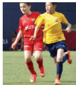
中国小球员表现不俗

前天,2015年巴萨全球精英赛在西班牙巴塞罗那开赛,11名来自中国的小球员首次参赛。巴萨全球精英赛是全世界青少年瞩目的赛事,是巴萨俱乐部官方组织的全球巴萨足球学校体系的比赛。昨天下午,巴萨俱乐部官方推特还专门推送了中国的小球员们在巴塞罗那参赛时的视频。