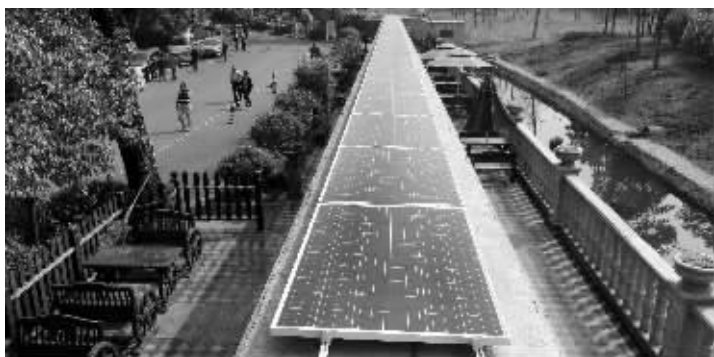
雨花功德园打造全国首家光伏发电陵园