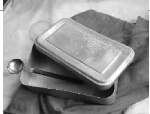
战友唐伟的遗物