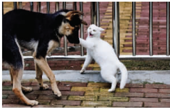
资料图片，图文无关

虽说家中占上风的是大宝，但二宝有二宝的优点，小宝有小宝的好处，两宝在主人心目中的地位也绝不可小视。每天与主人出门遛弯就是两狗才有的特权待遇，这点猫是没得比的。一次外出，二宝和小宝玩疯了，竟然与主人失去了联系。陌生的环境、陌生的人，一时间狗找不着主人，主人找不着狗，两狗没有了安全感方寸大乱。好在二宝很快冷静下来，它带着弟弟小宝第一时间找到了主人的自行车，原地不动地坐着死等。可以看出，二宝实在是冰雪聪明的，但它居然还无师自通熟悉兵法谋略，这“高狗一等”的智商就让主人颇为