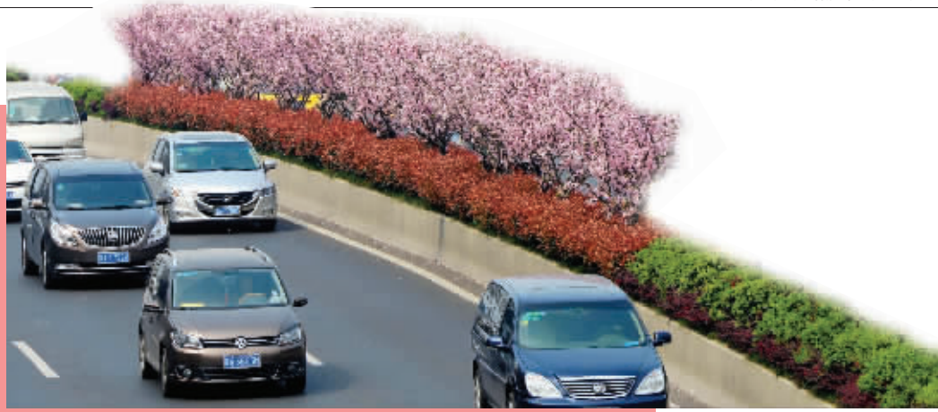
城西干道绿岛海棠盛开

现代快报记者了解到,南京的道路绿化缺乏统一的景观规划和专业指导。此外,老城区部分道路狭窄背阴,很难再种喜阳性的花灌木了。现代快报记者 余乐