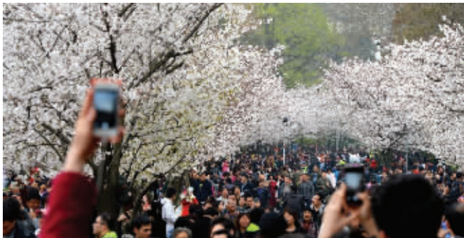
刚过去的周末,15万人涌到南京鸡鸣寺赏樱。这几天一下雨,樱花就要凋萎了

量为43毫米,据资料统计,南京清明日出现阴雨的率达86%,这与唐诗中“清明时节雨纷纷”相符。多雨的年份如1964年清明节气降水量达132毫米,发生了春涝。而少雨的1978年降水量只有4.9毫米,又出现春旱,这就变成了“清明时节清又明”。