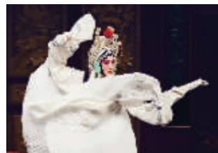
昆曲《白蛇传·断桥》剧照

4月12日晚7点半,昆曲品牌“春风上巳天”系列演出压轴大戏——经典折子戏专场,将在紫金大戏院上演。演出将由著名昆曲表演艺术家、梅花奖得主石小梅、胡锦芳、李鸿良领衔,中生代实力派昆曲表演艺术家龚隐雷、钱振荣、顾骏,优秀青年演员孙晶、徐思佳等担纲,江苏省演艺集团昆剧院三代精锐会聚一堂,为观众带来《天下乐·嫁妹》《跃鲤记·芦林》《桃花扇·题画》《白蛇传·断桥》四折最能体现南昆风格的经典传统剧目。