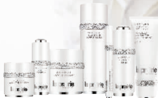
鱼子精华纯皙系列全产品组图