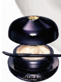
时光琉璃御藏 集效奢养眼唇霜