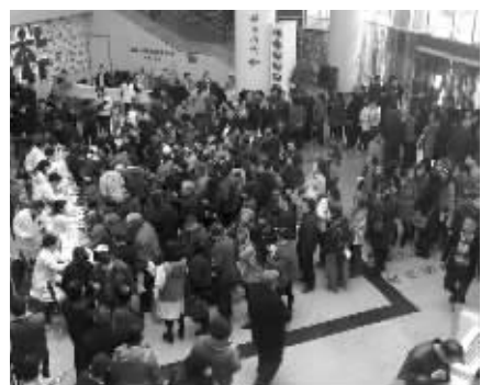
省人民医院义诊现场