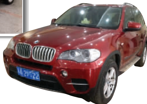
▲本照片由南京市恒锦车业提供