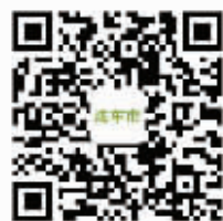
关注炫车市 好礼享不停