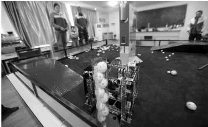
中学生玩转机器人