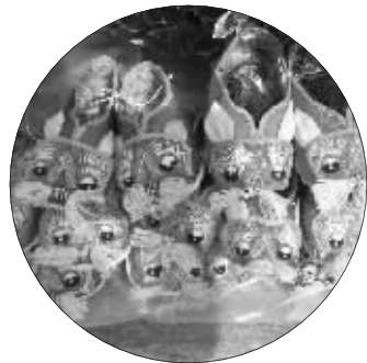
黄奶奶做的虎头鞋

昨天上午,记者看到黄奶奶时,她正在聚精会神缝制虎头鞋上的虎须,身边摆放着几双已经完成的虎头鞋。黄奶奶告诉记者,她老家在河南,十多年前跟女儿来南京生活。