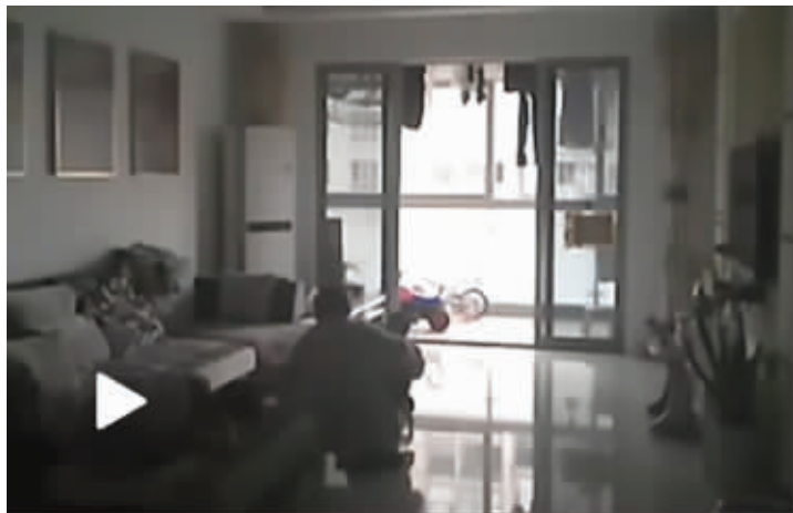
保姆扇女婴耳光 视频截图

近日, 微博上一个名为《绍兴嵊州崇仁保姆虐待9个月大女婴》的视频传得十分火热, 在视频中, 可以清楚地看到保姆的虐童行为, 打骂孩子, 甚至对着婴儿的嘴咳嗽、吐痰。帖子中, 户主还贴出了保姆写的认错书。22日, 孩子的妈妈告诉记者, 因考虑到保姆家里很困难, 当时并没有再追究下去, 小宝目前情况还好。面对多起类似事件, 公众呼吁政府有关部门加大力度规范混乱的保姆市场。 据新华社、《钱江晚报》