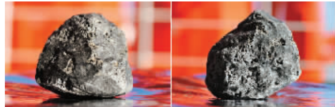
不同角度的灶神星陨石

除月岩外, 陨石是人类获得的唯一地球外岩石样品, 堪称“天外珍宝”。在中国第30次南极科学考察中, 我国科考队员在南极发现一块1300克的陨石, 经科学检测为珍贵的灶神星陨石。