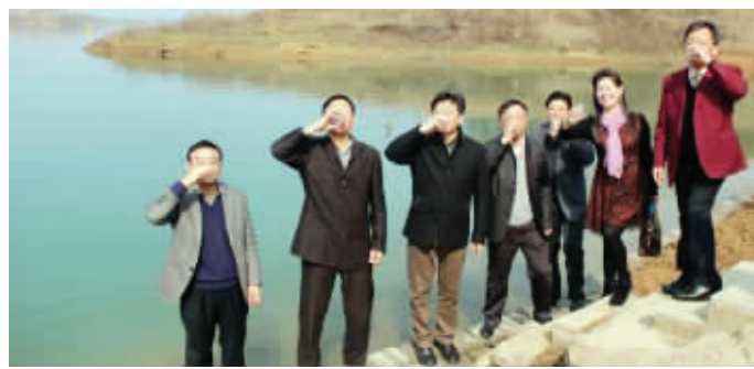
活动仪式现场, 一众人舀取漳河水直接喝下

据了解, 我国还没有一部家政市场的专门法律, 但数字显示相关从业人员已有上千万。而保姆是最被重视的一个家政主体, 但长期以来, 保姆技能无保障, 道德素质参差不齐等现象困扰很多家庭。在这次的浙江保姆虐童案后, 公众再次呼吁相关部门能够规范保姆市场, 完善管理体系和监督机制。