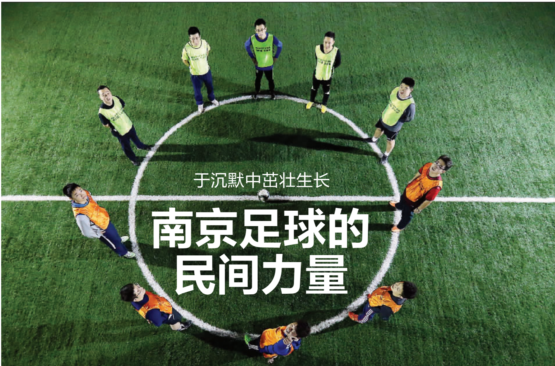
晚上,足球爱好者在栖霞区一所民工子弟学校足球场里踢5人制足球。这座灯光球场也是足球爱好者出钱修建的