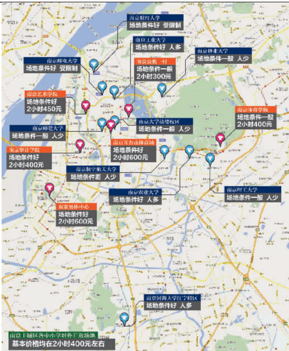
南京业余足球场地地图 制图 沈明