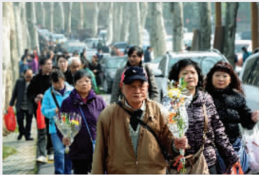
昨天，南京扫墓人流量出现井喷