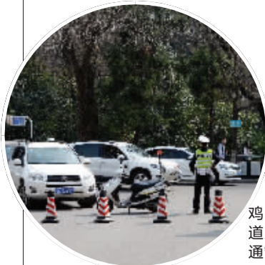
昨天，鸡鸣寺周边道路实施交通管制

随着地铁三号线的逐步完工，越来越多的市民盼着它的开通。昨天，现代快报记者看到，微博上有网友评论，“这个春天最浪漫的事，也许就是坐着地铁三号线去鸡鸣寺赏樱花。”