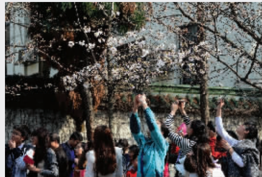
市民对着已经绽放的樱花猛拍