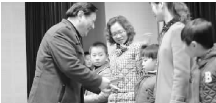
德育基金会颁奖现场