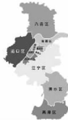
现代快报记者 吴杰 整理

不许拿出手机搜索,你能说出南京现在有几个区吗?其中面积最大的区是哪一个呢? A:13个,玄武 B:12个,江宁 C:11个,六合 D:11个,江宁