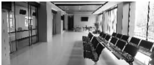
办证服务中心内景