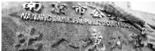
新的办证服务中心门牌已经制作好

地铁: 1号线张府园站3号出口出来,行至白下路口,步行10分钟。3号线(预计4月份营运)常府街站1号出口出来,沿太平南路由北向南方向行至白下路口左转,步行8分钟。