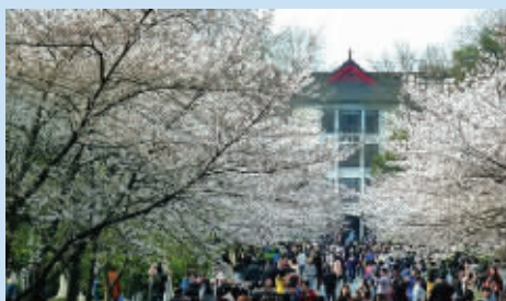
每年春天，南林大的樱花大道也是一道美景 资料图片