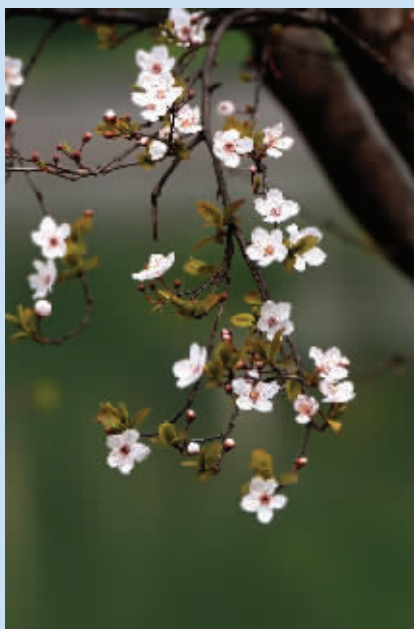
中山东路上紫叶李开得正艳