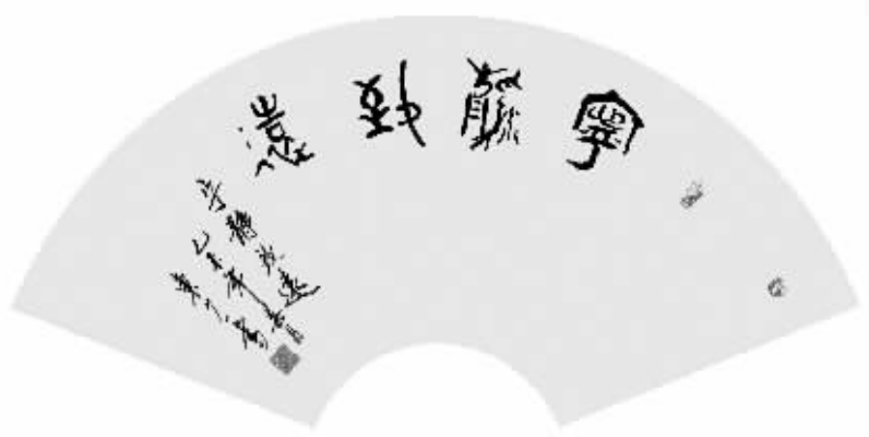
本版书法作品均为东少一作品