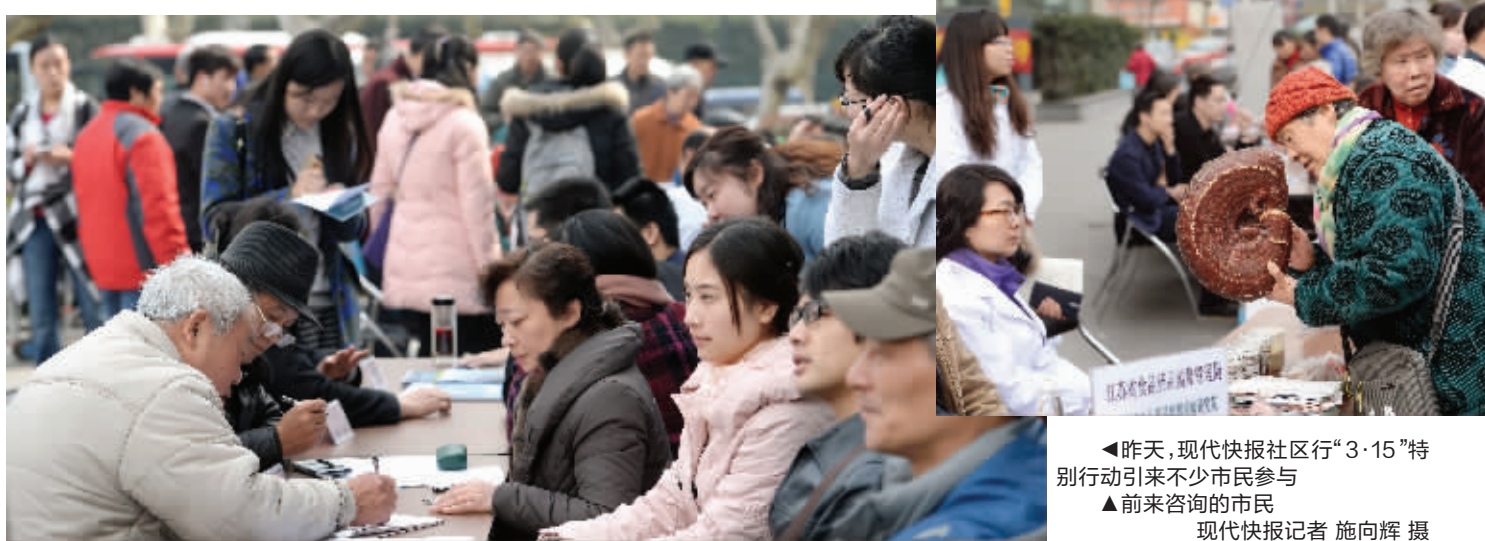
▲昨天,现代快报社区行“3·15”特别行动引来不少市民参与 ▲前来咨询的市民