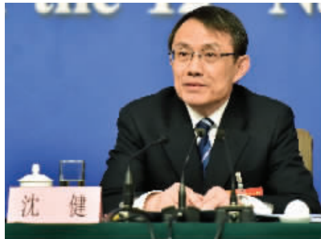
江苏省教育厅厅长沈健