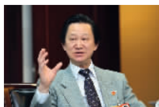
全国人大代表刘璠 资料图片

根据法国民防的统计,同样伤势的重伤员,在30分钟内获救,其生存率为80%,在90分钟内获救,其生存率仅为10%以下。事故发生后尽快抢救,缩短被困伤员的获救时间,是减少事故死亡率的关键,