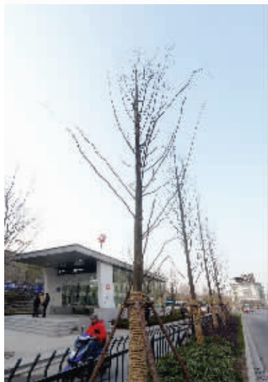
鸡鸣寺公交站至地铁四号线浮桥站一带以前是光秃秃的,现在也种上了水杉

2011年为给地铁“让路”,三号线城中段13个站点、1031株行道树被迫“搬家”。南京市民钟爱的法桐被移走200株左右。昨天是植树节。现代快报记者获悉,地铁三号线沿线树种补植将于3月底完工。其中,当年移树较密集的太平北路补植70株水杉,共计补植约300株乔木。其他站点也正在补种。 现代快报记者 余乐