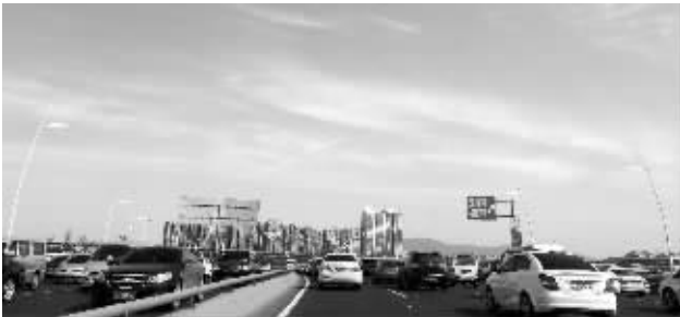
高架上，能见度很高