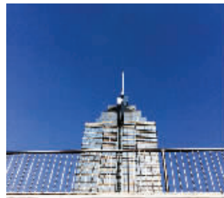
昨天,蓝天下的园区环球188大楼

在冷空气的帮助下,昨天的苏城一扫阴雨阴霾,出现难得的“水晶蓝”。蓝天白云,阳光明媚,微风拂拂,空气质量更是达到优秀,所以大伙的心情都是棒棒哒。