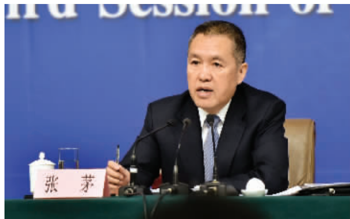
国家工商总局局长回答记者提问

我想,一个就是我们加快这方面的法治建设。因为法律法规相对滞后,工商总局已出台了《网络交易管理办法》,但还不够完善,我们现在正在积极推进电子商务立法。第二,完善监管方式。传统的监