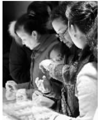
黄金饰品柜台人头攒动

各大超市、家电卖场也打起促销牌,糖果、日化用品、卫生用品等都有产品促销。珠江路上一家数码产品卖场,昨天生意也不错,某品牌一款微单相机卖断货。