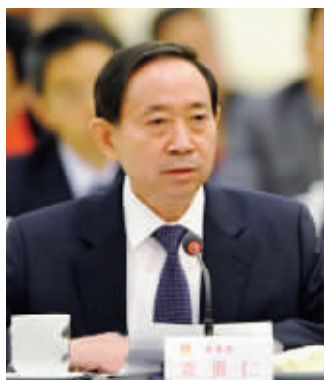
教育部部长袁贵仁 资料图片

对于男女教师比例的问题,沈健表示自己多年前就开始进行调研。小学、中学、大学这个问题都存在,最突出的还是在学前教育阶段,所以最迫切的是先要解决幼儿园男教师缺失的问题。“江苏5000多所幼儿园,多年来没有一位男教师。为了改变这个现状,江苏在2009年实行了幼儿男师范生免费培养。计划在2020年前,让5000多所幼儿园都能有至少一位男教师。”