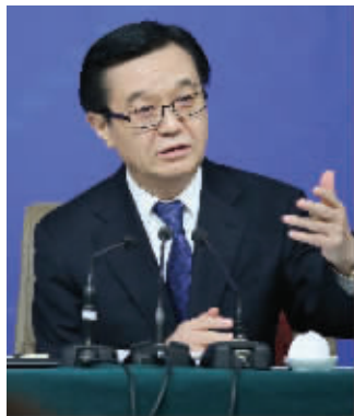
商务部部长高虎城

昨天上午,十二届全国人大三次会议举行新闻发布会,商务部部长高虎城围绕“培育消费新亮点、构建开放新格局”回答了中外记者的提问。在被问及实施多年的自由行政策会否收紧时,高虎城介绍说,赴港游会根据需要调整。据悉,去年中国人在境外消费已超1万亿人民币。