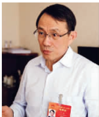
江苏省教育厅厅长沈健

随着中国居民消费观念的改变,这种局面也会像前些年的“你有、我有、人人有”这种排浪式的、模仿性的消费逐步转向理性,回到正常的消费状态。