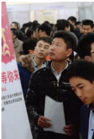
招聘会吸引了约4000人